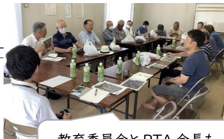
教育委員会とPTA会長も 参加しました。

見守りボランティアさんの方からは、「時々走る子がいるが、とても危険なので学校や家庭でも『登下校中は走らない』ように指導してほしい」という意見が多数出ました。ご家庭でもご指導よろしくお願ひします。