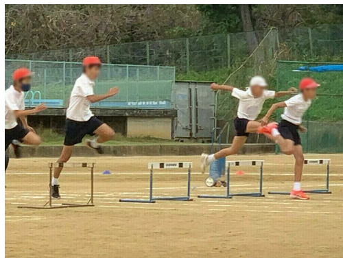
(画像は加工して掲載しています)

保護者の皆様方には、本年度最初の参観ということでお忙しい中、多数ご参観いただきありがとうございます。コロナ感染の完全収束がまだ見えませんが、今後の