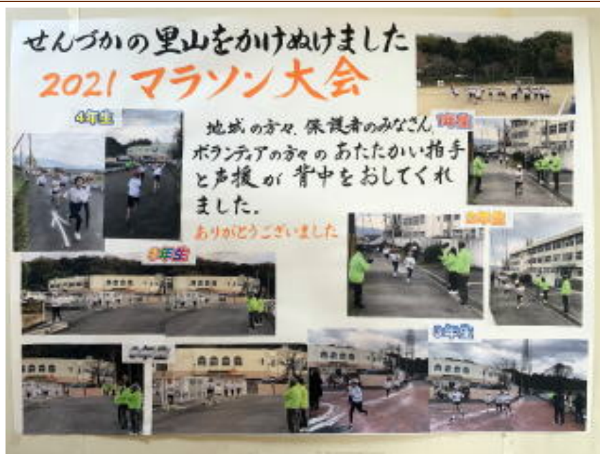
校長室前に掲示しています。

マラソン大会までの約1ヶ月間、飛沫感染防止の観点から奇数学年と偶数学年に分かれての2部制で、安全と健康に考慮しながら毎朝のかけ足タイムを行い、体力作りに取り組んできました。がんばってきた成果を発揮する機会として、昨年度実施できなかったマラソン大会を実施できたことは本当に嬉しく思います。また、マラソン大会実施に際して、子どもたちの頑張っている様子を一目ご覧いただきたくご案内をさせていただいたところ、たくさんの地域の方々、保護者のみなさま、ボランティアの方々が駆けつけてくださり、大きな拍手とあたたかいご声援を贈ってくださいました。