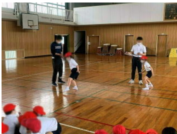
写真は加工して掲載しています

マスクをはずして、笑顔で大きく口を開けて歌わせてあげたいなあっと思ってしまいました。今しばらくはしかたありません。