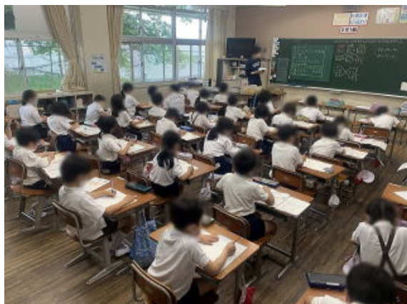
写真は加工して掲載しています

2年生の教室です。みんな落ち着いて勉強しています。1時間目は算数です。ひきざんの答えを確かめる式の学習です。