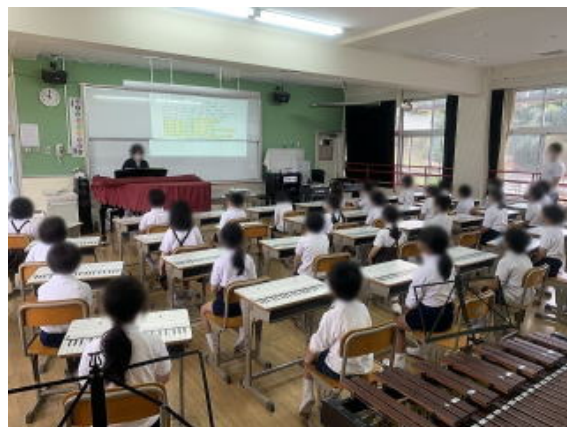
写真は加工して掲載しています

2年生の教室です。みんな落ち着いて勉強しています。1時間目は算数です。ひきざんの答えを確かめる式の学習です。