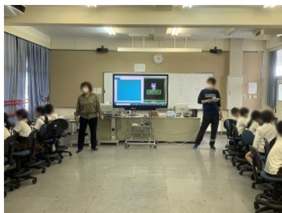
写真は加工して掲載しています

4時間目は、体育。体力測定で反復横跳びを測っていました。この反復横跳びは意外とリズム感が必要で、2年生にとっては、難しいのですよね。