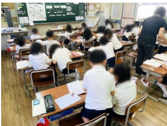
1年生 写真は加工して掲載しています

みんな一生懸命お話を考えています。考えたお話を書き表すのも一苦労。考えながら、「も、も、も・・・う～ん。」ひらがなを思い出すのも必死です。でも、友だちといつしよに考えるのも、となりの子に書き方を相談しながらやるのも楽しそうでした。