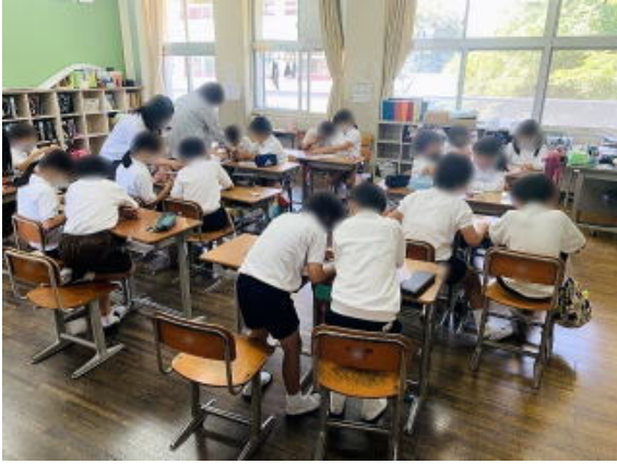
4-1 写真は加工して掲載しています