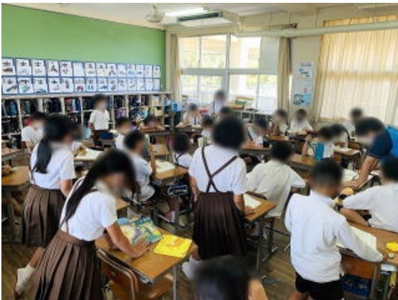
5年生 写真は加工して掲載しています