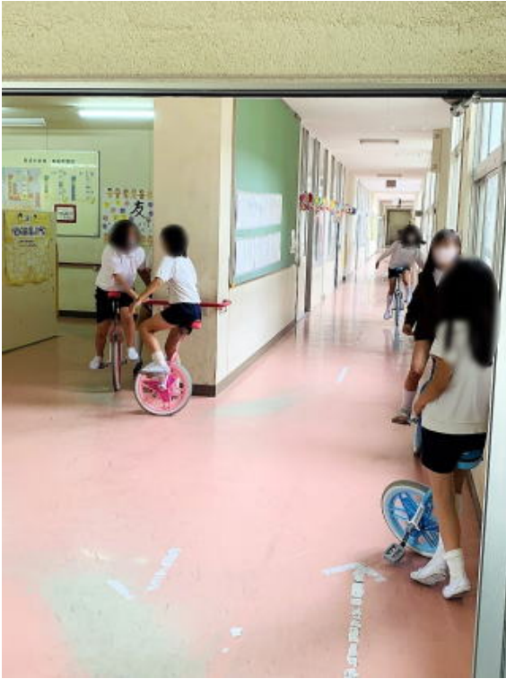
写真は加工して掲載しています