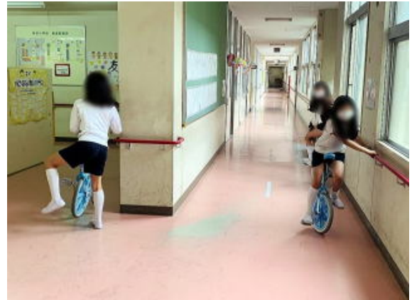
写真は加工して掲載しています