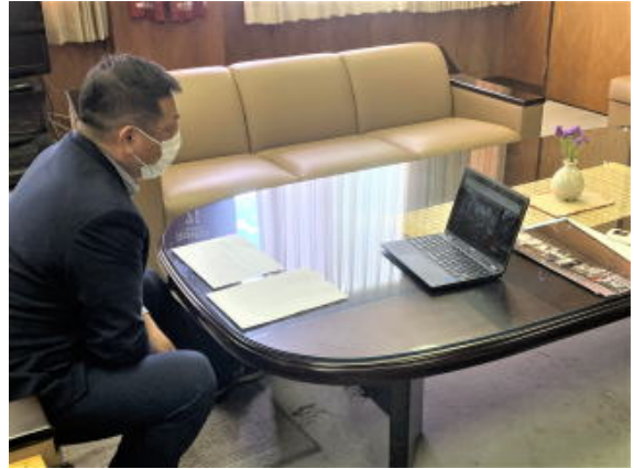
市長さんと3年生がオンラインでつながっています。