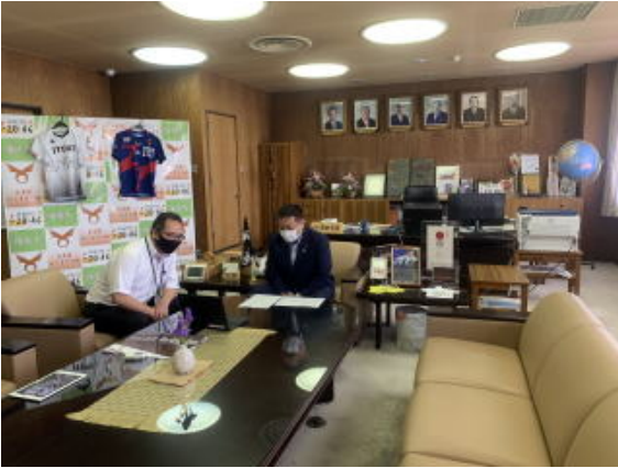
市長さんに対応していただきました