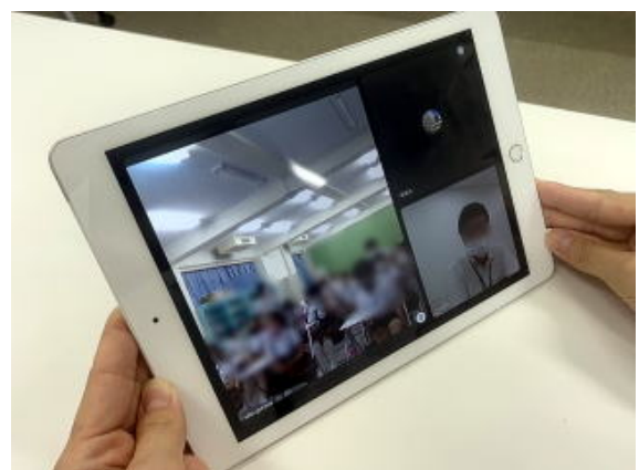
3年生が市役所の職員さんにオンラインで質問しています。 写真は加工して掲載しています

3年生がオンラインでの庁舎見学を実施しました。コロナ禍になる前は、例年3年生はこの時期に橿原市役所まで庁舎見学に出かけます。議場に入り、橿原市の概要と議会や橿原市のマスコットキャラクターなどについて学習します。2年前は新しくできたミグランスにも見学に行きました。