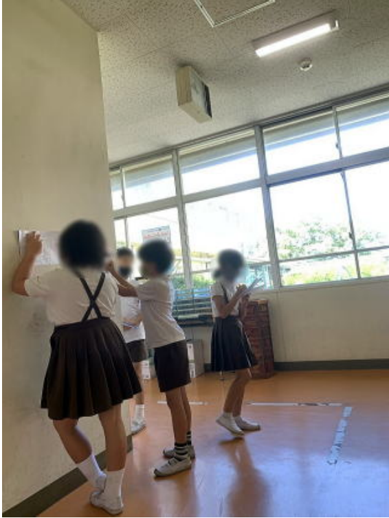
画像は加工して掲載しています