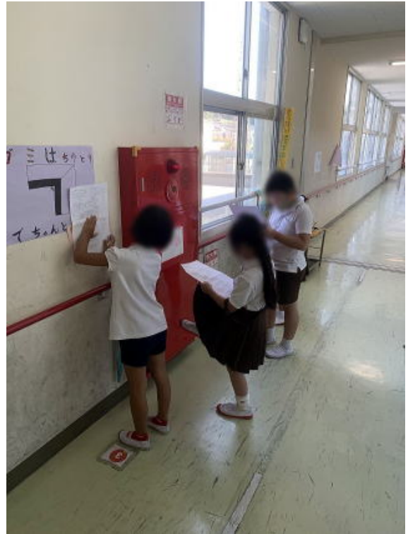
画像は加工して掲載しています