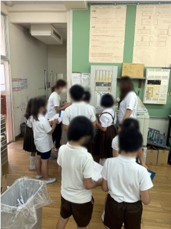
画像は加工して掲載しています