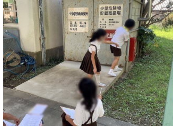
画像は加工して掲載しています