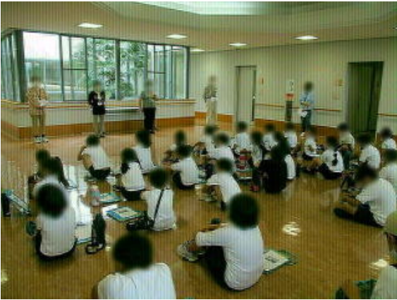
画像は加工して掲載しています