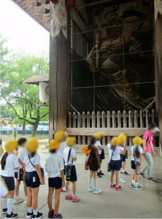
画像は加工して掲載しています