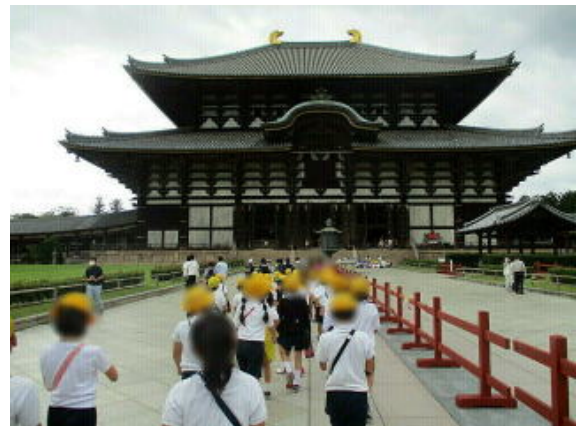
画像は加工して掲載しています