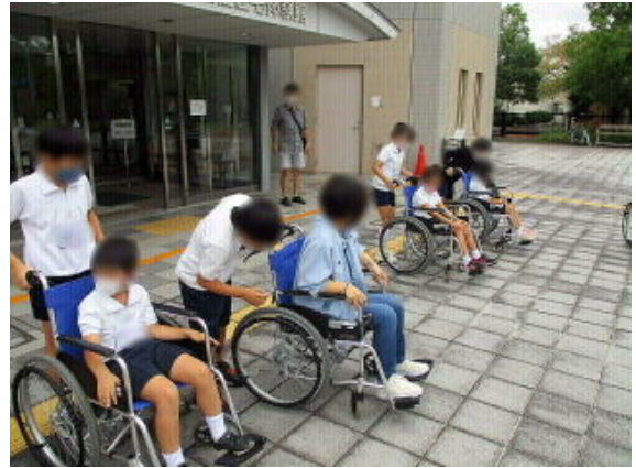
画像は加工して掲載しています