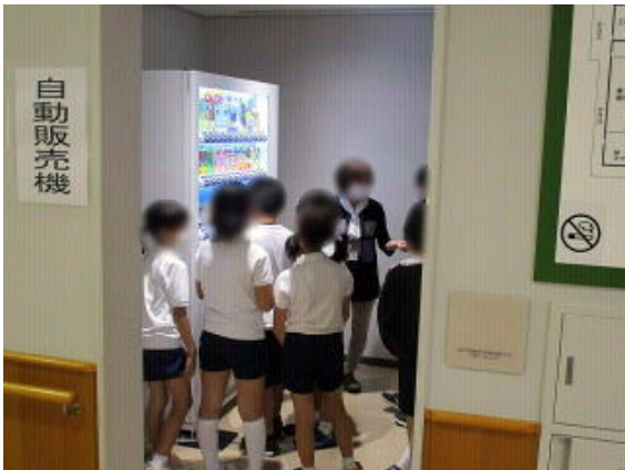
画像は加工して掲載しています