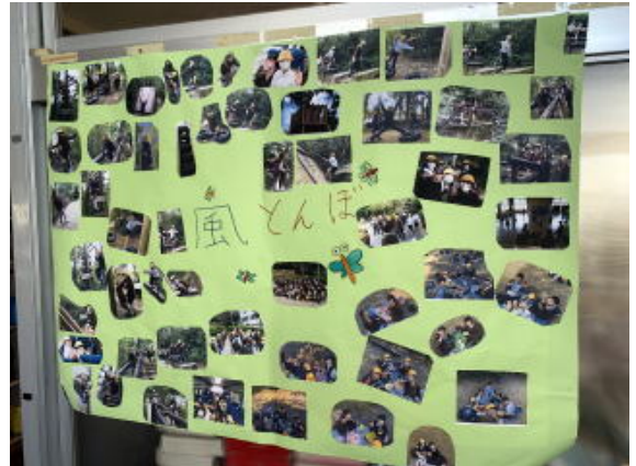
5年生 遠足の写真「風とんぼ」 写真は加工して掲載しています