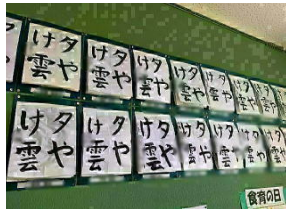
6年生 書写「夕焼け雲」 写真は加工して掲載しています

また、3時間目・5時間目・6時間目に人権教育懇談会と称して多目的室（南館3階）で、「みんなで子育て・親育ち・つながることは素敵なこと」と題してこの機会にともに子育てのことやつながりの大切さについて考え合う時間を設定しています。約40分程度のミニ学習会です。探偵ナイトスcoop・アナと雪の女王・ACジャパン（日本公共広告機構）のCM等から人権に関わる意識について映像を見ながら、ほっこりと考える時間としたいと考えています。是非、授業参観とセットでお越しただけたら幸いです。6時間目、低学年の託児も可能ですので、担任の先生まで連絡帳にてお知らせください。