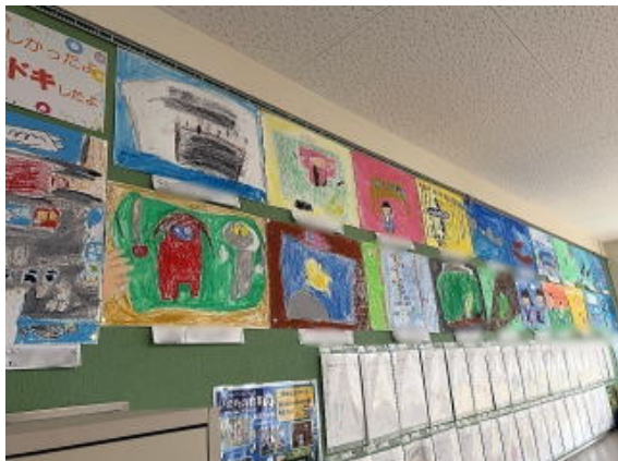
2年生 楽しいことドキドキしたこと 写真は加工して掲載しています。