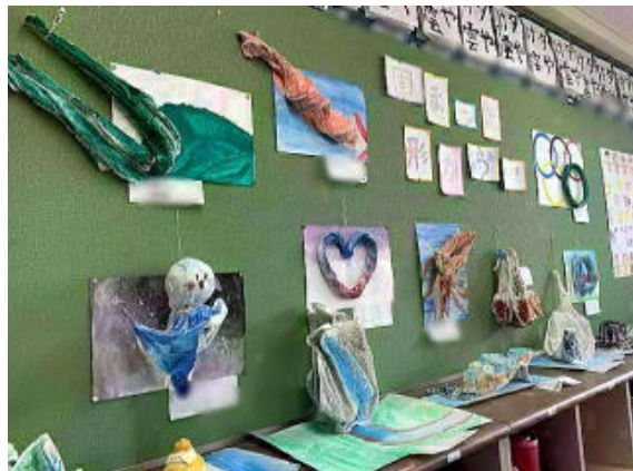
6年生 固まった形から 写真は加工して掲載しています