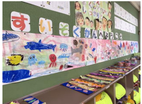
1年生 すいぞくかんへようこそ 写真は加工して掲載しています。