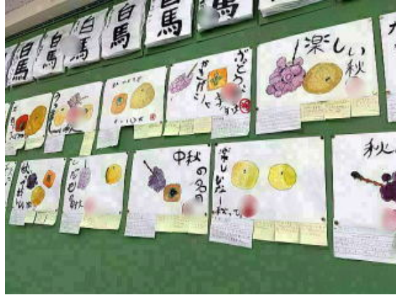
4年生 くだもの秋 写真は加工して掲載しています