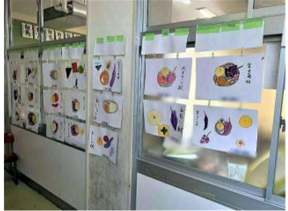
4年生 くだもの秋 写真は加工して掲載しています