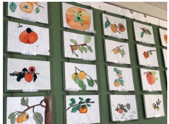
3年生 かき 写真は加工して掲載しています。