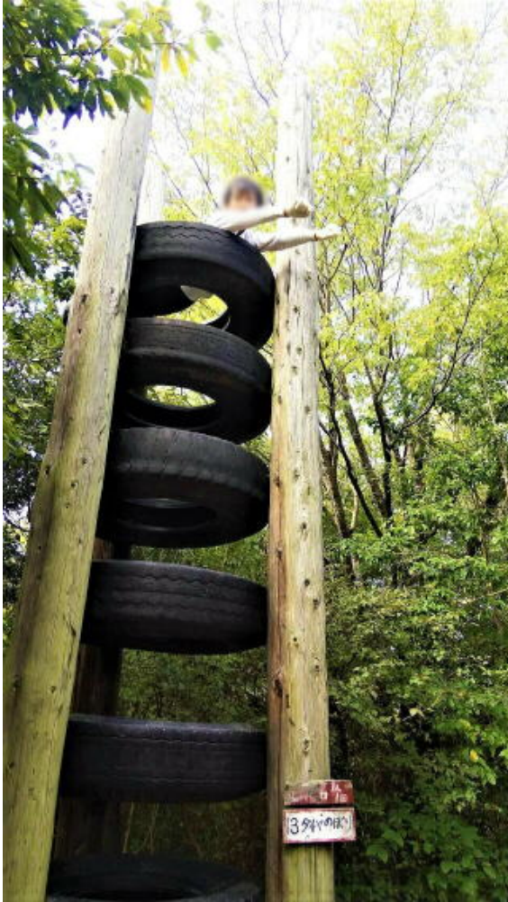
画像は加工して掲載しています

雨天用のプログラム「まが玉づくり」のキットも持ち帰り、今度また図工の時間に作成したいと計画しています。