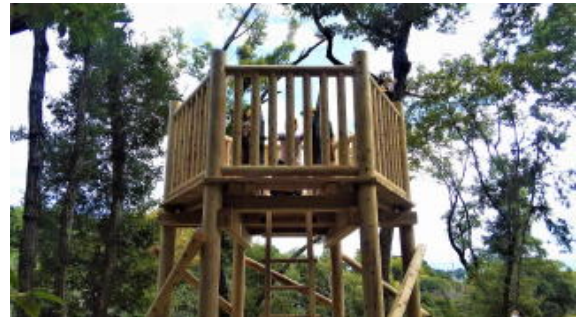
画像は加工して掲載しています