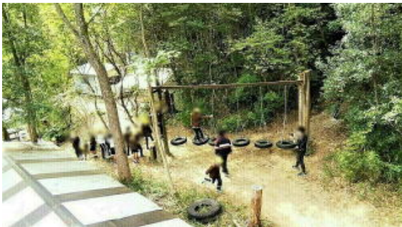
画像は加工して掲載しています

ここでの主な活動は、野外でのフィールドアスレチックでした。曾爾高原ではあいにくの天気でしたが、今日はその分を取り返すかのようにみんなフィールドアスレチックに夢中になって活動していました。10数個あるアスレチックを1週目はみんなゆっくり回り、最初おそるおそる慎重にやっていた子も慣れてくるとどんどん楽しそうに挑戦し、3週以上回っていた子もいました。お弁当も自然いっぱいのキャンプファイアー場でおいしくいただき、午後からは施設内の体育館でドッジビーを楽しみました。