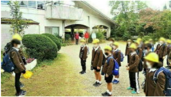
画像は加工して掲載しています

日々ころころ変わる天気予報にひやひやしていましたが、今日は絶好の遠足日和となりました。5年生は大和郡山市にある里山の駅「風とんぼ」に行ってきました。ここはもともと大和郡山市の野外活動センターですので、1学期実施した曾爾へ野外活動に行ったときのように入所式も退所式もあり、係の子どもたちを中心に礼儀正しくきちんと式を行うことができました。