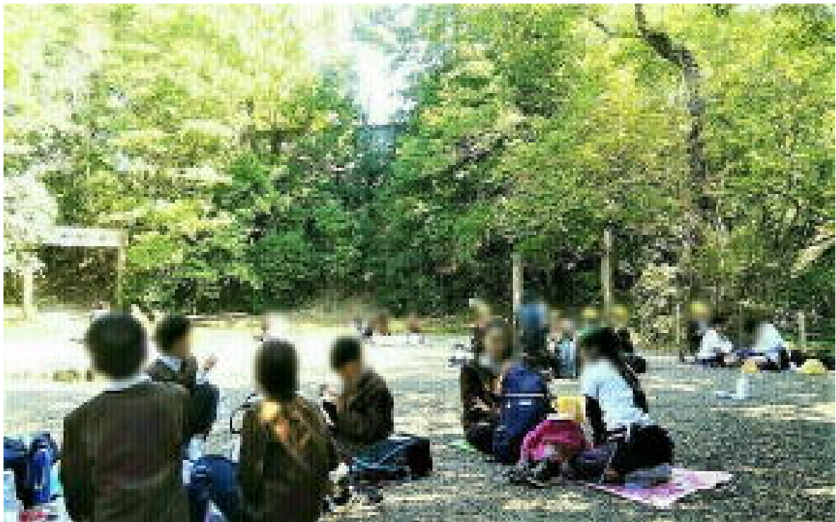
画像は加工して掲載しています

いよいよ秋も深まり、日の暮れるのも早くなってきましたが、遠足的行事は、残すところ6年生の修学旅行のみとなりました。11月18日・19日もいいお天気でありますように！