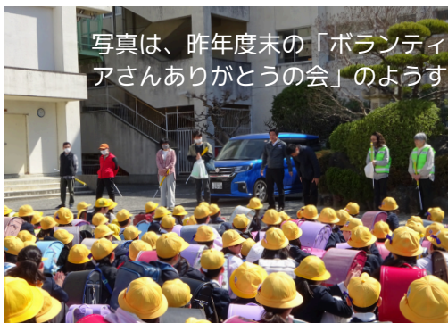
写真は、昨年度末の「ボランティアさんありがとうの会」の様子

高学年の人たちが調べてくれたことによると、「おはようございます」は、「お早くからご苦労様です」というねぎらいの言葉だそうです。わたしたちの周りにはたくさんの「お早くからご苦労様です」があふれています。ぜひこの「見えないけれどもすてきなプレゼント」を渡して感謝の気持ちを伝えてほしいです。でも、自分から声をかけるのに緊張したり、恥ずかしかったりする場面もあるかもしれません。そんな時は、会釈や目を合わせるということから始めてみましょう。できれば笑顔を添えてね。