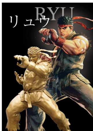
かしはらナビプラザ前