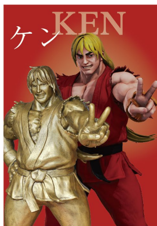
橿原神宮 駐車場入口前

column 橿原市とカプコン 株式会社カプコンの創業者の辻本憲三会長が橿原市出身というご縁から、1995年に橿原市で開催された「ロマンピア藤原京'95」へパビリオンを出展いただきました。その後2022年には、橿原市と株式会社カプコンは包括連携協定を締結しました。橿原市の活性化やまちづくりに関する取り組みを、今後も協力して進めていきます。