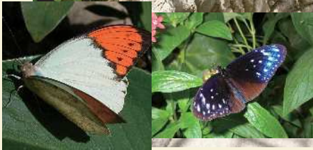
남게전단원기나비 쓰마베니쵸 남게전단원기나비 쓰마무라사키마다라 흰머호랑이나비 시로오비아게하