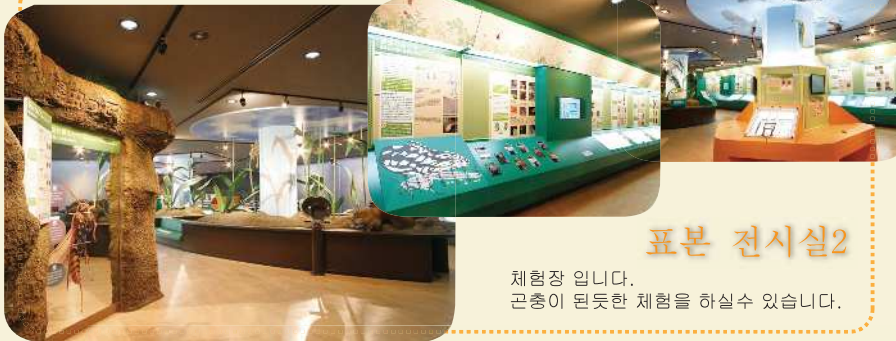
표본 전시실 2

고생대에서 현대에 이르기까지의 생명의 탄생과 진화의 역사들을 소개합니다.