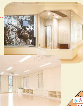
특별생태 전시 코너 정보 코너