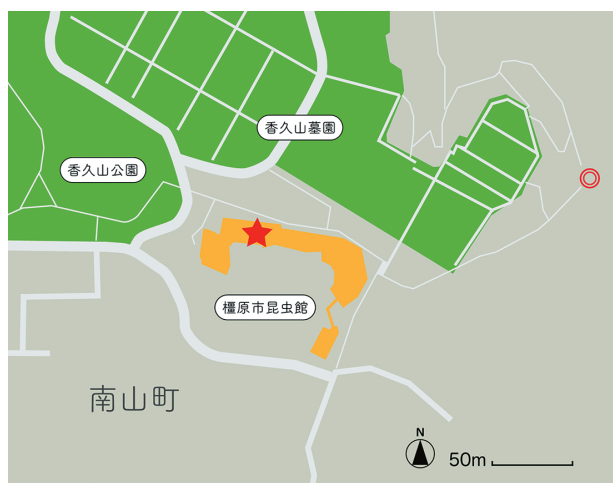
図2 調査場所．★：R3年度調査地点，◎：R2年度調査地点