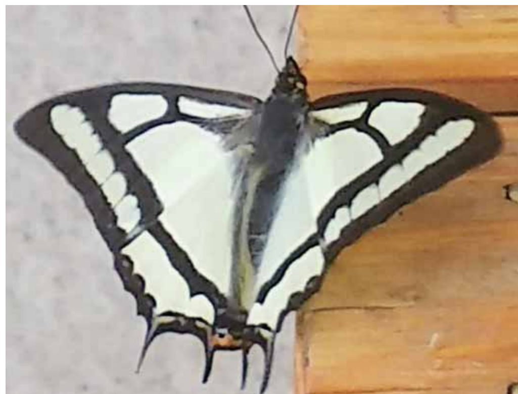
発見された時の写真