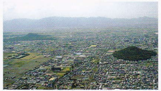
▲耳成山と橿原市街