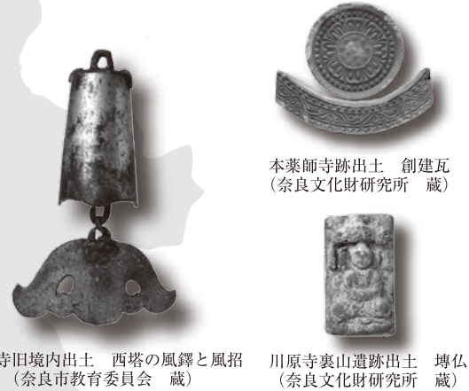
大安寺旧境内出土 西塔の風鐸と風招 (奈良市教育委員会 蔵)