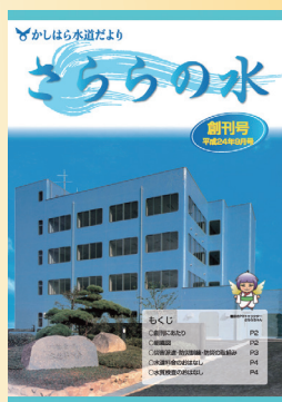
創刊号 上下水道部旧庁舎