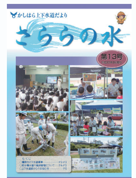
第13号 給水訓練、出前講座(水道水がつけられるまで)の様子