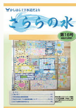
第16号 ミストシャワーを贈呈した子ども達のお礼のメッセージ