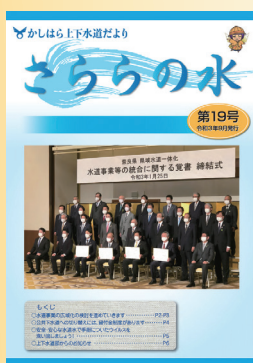
第19号 水道事業等の統合に関する覚書 締結式