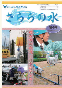
第4号 災害対応訓練の様子