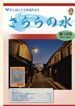
第18号 マンホールカードのモデルとなっている今井町の街並み