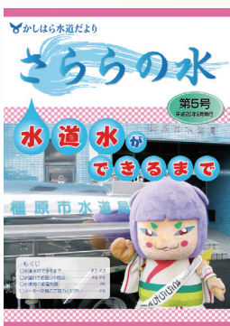
第5号 給水車とさららちゃん