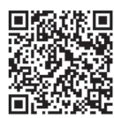
水質検査結果ホームページ