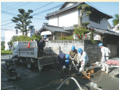
熊本市での漏水修理工事の様子