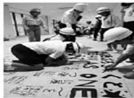
檀原市立小学校 8校の5、6年生 約640人が10月 市役所分庁舎とホ テルが入る建設中 の複合施設を見学 しました。