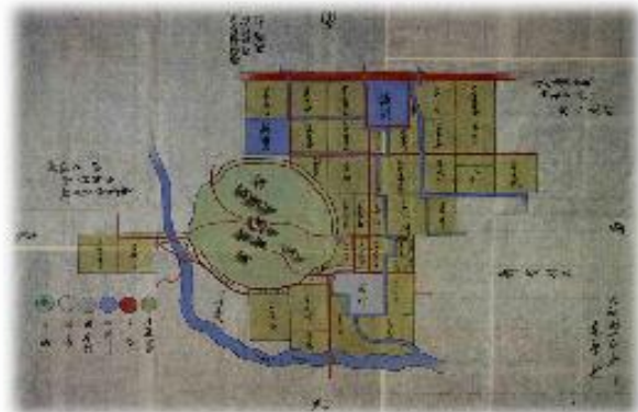
「大和国十市郡木原村絵図」