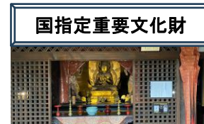
国指定重要文化財