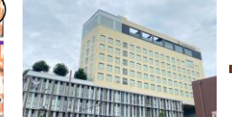
榎原市役所分行舎 (ミグランス)