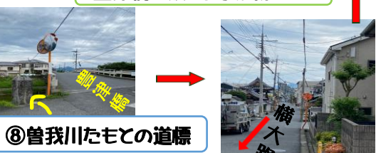
⑧曾我川たもとの道標