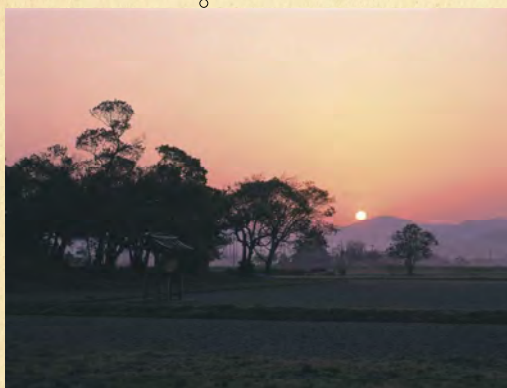
●世界遺産登録推進課