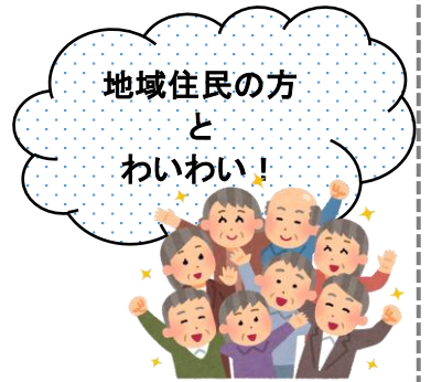
元気な一歩会 参加者の声 ♪