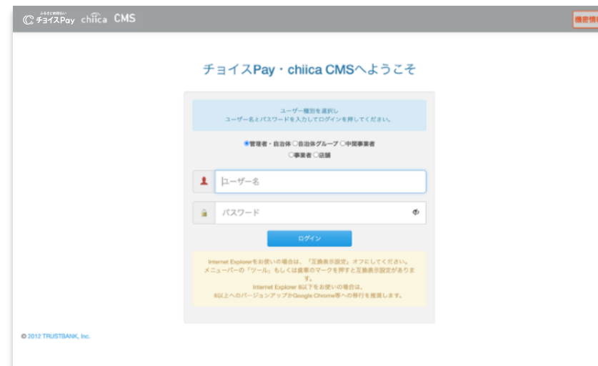
※実際のCMSログイン画面

■本書「チョイスPay 事業者様・店舗様向け 簡易マニュアル」は、ふるさと納税払い チョイスPayを利用する際にご活用いただく「チョイスPay・chiica CMS」の簡易操作マニュアルです。店舗でのご利用設定から実際の決済、ポイントの取消までの手順を記載しております。「チョイスPay・chiica CMS」を利用するなかで、ご不明点がございましたら本書をご活用ください。