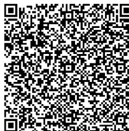
④ Ginásio da Escola Fundamental de Yagi