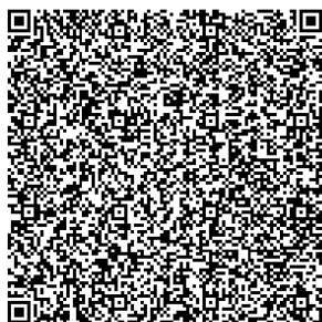
① Centro de Bem-Estar Yawaragi-no-sato