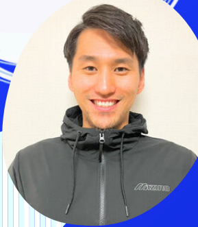
砂間 敬太氏 東京オリンピック 競泳日本代表選手