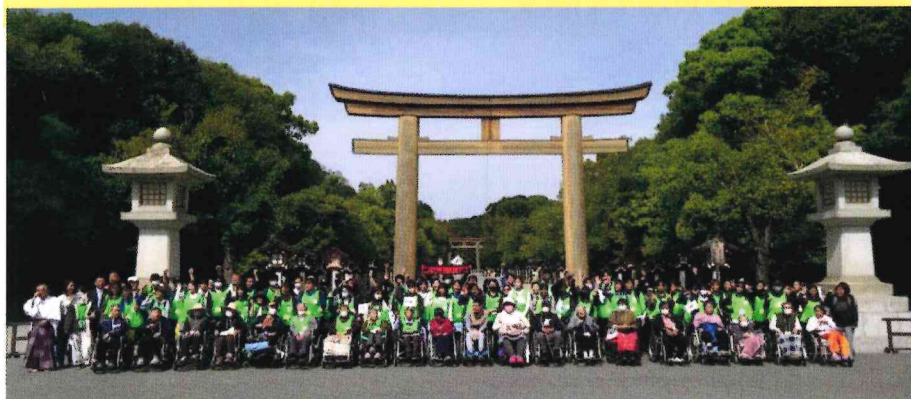
令和8年4月19日 第7回の集合写真