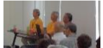
講師：朝倉台自主防災会

9月27日に市民活動講座を開催しました。 「令和の時代の防災を学びませんか？」 ～暮らしと防災～いつかのために今備える