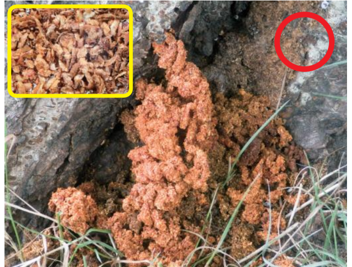
クビアカツヤカミキリの幼虫が出すフラス 枠内・指ですりつぶしてルーペで見ると、繊維質が無い