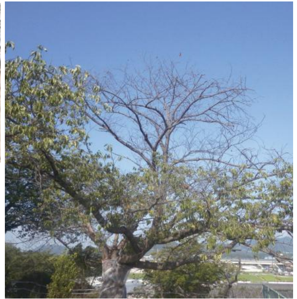
枝の一部が枯れたサクラ 被害初期は一部の枝が枯れることが多い