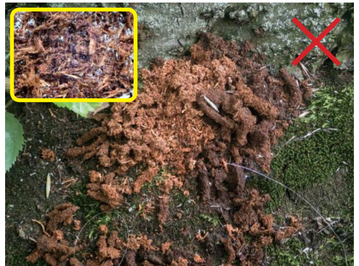
良く似たフラス（他のカミキリ） 枠内・指ですりつぶしてルーペで見ると、繊維質が多い