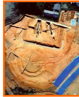
●上空より見た 植山古墳