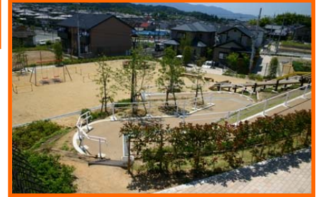
●2号公園 (五条野フレンドパーク)

植山古墳は、本区画整理事業の開発中に発見された古墳です。この古墳は、長方形墳であるとともに、石室を有する「双室墓」と呼ばれる、推古朝の築かれたと考えられます。例の少ない古墳で、西石室は7世紀半頃に築かれたと推定されています。