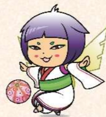
橿原市観光PRキャラクター 「さらちゃん」