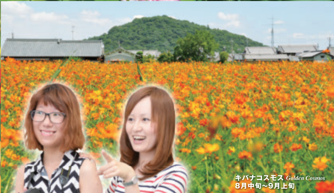
キバナコスモス Golden Cosmos 8月中旬~9月上旬