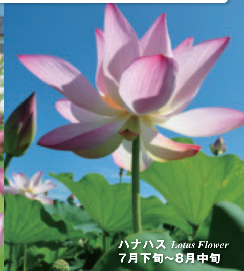
ハナハス Lotus Flower 7月下旬~8月中旬