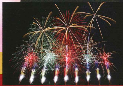
秋の夜空を彩る 万葉浪漫花火 18日18:00～