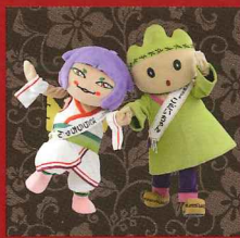
さらちやんやとこだいちゃん