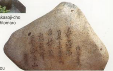
Estanque de Daigo, Daigo-cho Autor: Emperador Jitō