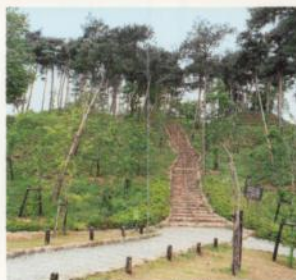
9 Los Túmulos de Nizawa Senzuka