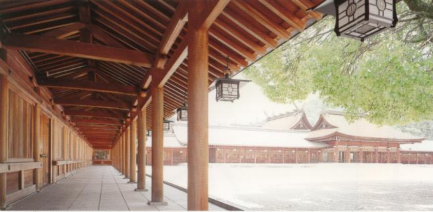
1 Santuario de Kashiwara