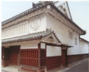
Casa de la Familia Toyoda