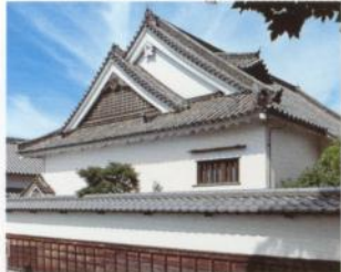
Casa de la Familia Imanishi

Esta casa dignificada da la impresión de un castillo más bien que una casa. Fue construida en 1650, hace unos 350 años, y es el edificio más antiguo de Imai-cho. El método especial usado para construir su tejado se llama "yatsumune zukuri".