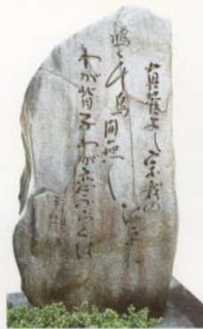
Santuario de Iware, Nakasoji-cho Autor: Kakinomoto Hitomaro