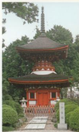
4 Designado Valor Cultural Nacional, Templo Kume (torre de Tahou-tou)

Se supone que este conjunto de túmulos antiguos y pequeños, esparcidos por la ladera del monte fueron hechos entre los siglos 4 y 7. Los túmulos oscilan en tamaño entre 10 a 30 m en diámetro, y muchos de ellos parecen hemisféricos cuando vistos desde el lado. Hay alrededor de varios cientos de túmulos en total. En el museo ubicado cerca de los túmulos, usted puede ver muchas reliquias y artefactos recogidos a lo largo de los años de excavaciones en el lugar, tales como espadas y adornos personales. (Museo Senzuka: 858-1 Kawanishi-cho, ciudad de Kashiwara, Tel: 0744-27-9681/Horas de visita: 9:00 am - 5:00 pm; Cerrado: los Lunes y del 25 de Diciembre al 5 de Enero)