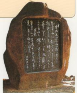
Parque del Barrio, Shirakashi-cho Autor: Nakano-Oueno Miko (Príncipe Nakano-Oue)