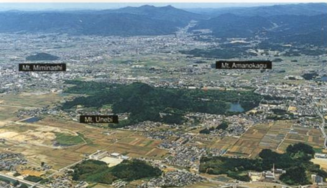
2 Las Tres Montañas Yamato

(934 Kume-cho, ciudad de Kashiwara, Tel: 0744-22-3271)