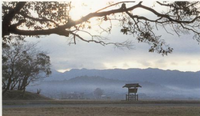
6 El emplazamiento antiguo del Palacio Fujiwara

Hay tres montañas situadas alrededor del centro de la cuenca de Nara como si estuviera flotando - Miminashiyama en el norte, Amanokaguyama en el este y Unebiyama en el oeste. Estas tres montañas son más bien pequeñas, con una altura de menos de 200 m. Antiguamente, la gente consideraba Unebiyama ser una mujer y las otras dos montañas, hombres. Un mito antiguo todavía persiste en que Miminashiyama y Amanokaguyama lucharon para atraer hacia sí el afecto de Unebiyama. (Ciudad de Kashiwara)