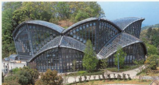
7 Museo de Insectos de la Ciudad de Kashiwara