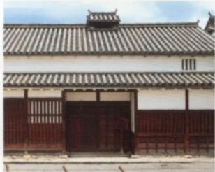
Casa de la Familia Kometani antigua