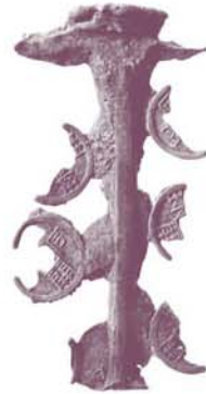
大阪市指定文化財 大阪歴史博物館 蔵