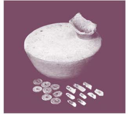
奈良文化財研究所 蔵